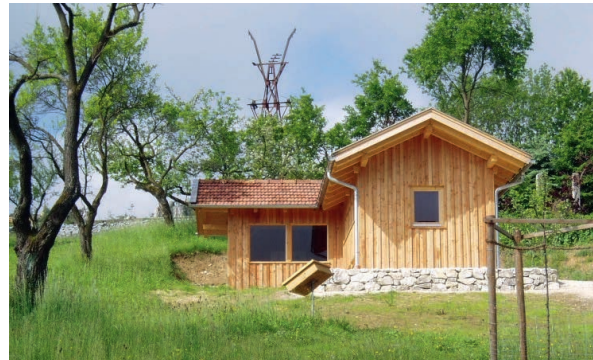
Lehrbienenstand im Obstgarten

Am „Erlebnislehrpfad Kulturlandschaft“ säumen heckenreiche Streuobstwiesen, Weiher, Bachwiesen und knorrige Hangwälder den Weg. Ein Lehrbienenstand im Obstgarten und der Beobachtungsstand an den Weihern bieten vielfältige Möglichkeiten der Naturinformation und Naherholung.