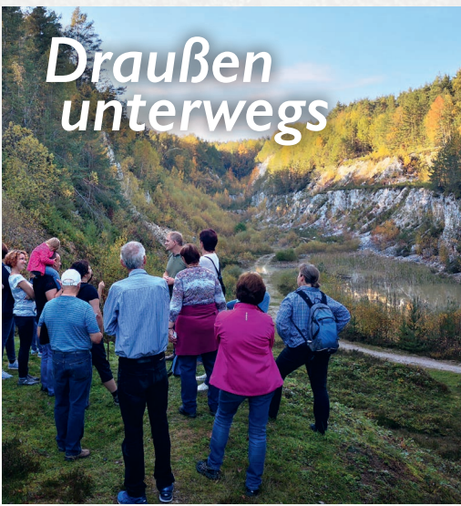
Quarzbruch am Großen Pfahl

Der Lehrpfad „Großer Pfahl“ führt Sie auf zwei Rundwegen zu weiß schimmernden Quarzriffen, beweideten Pfahlheiden und einem tiefen Quarzbruch. Am Lehrpfad „Kulturlandschaft“ finden Sie Obstwiesen, Naturweiher und Bachwälder. Infotafeln und Beobachtungsstände laden Sie zum Informieren und Erleben entlang des Pfahl-Steiges ein. Der Pfahl-Steig führt nach ca. 2 km zum Stadtzentrum. Der Pfahl-Radweg mündet nach ca. 1,5 km in den Regental-Radweg.